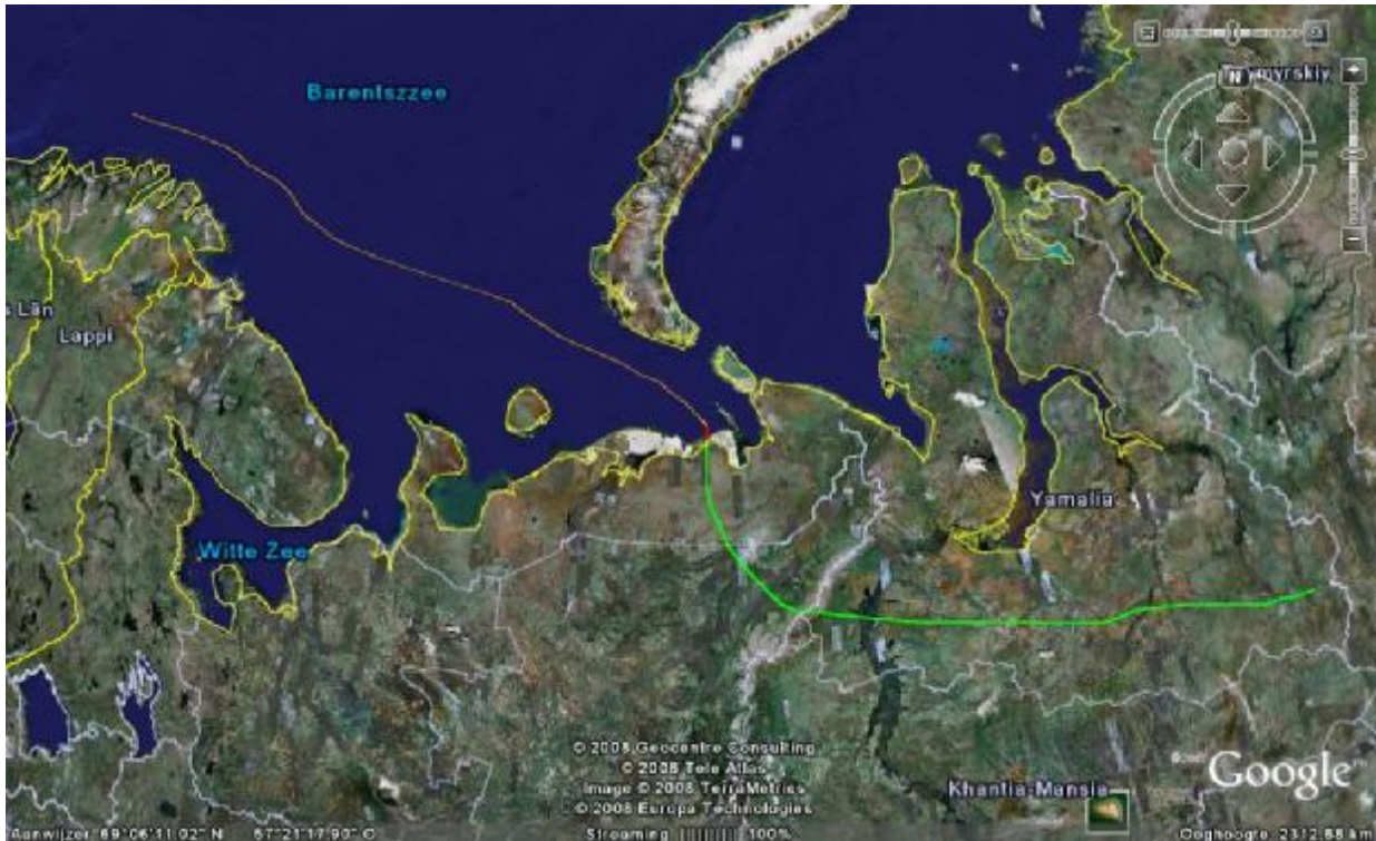
Figuur 2: Overzicht en ruimtelijke samenhang tussen de transactie, het project en de projectomgeving